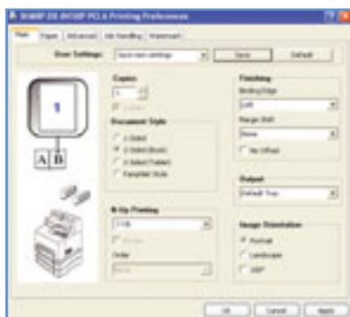
Driver di stampa intuitivo